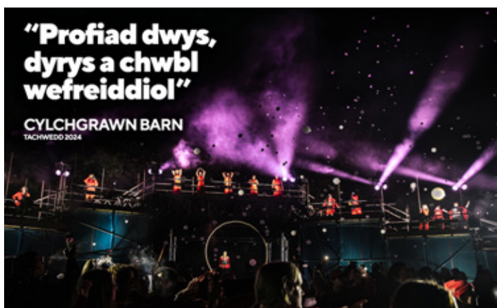
Adolygiad Olion (2024)

Mae'r amgylchedd rydym yn gweithio ynddi yn gynyddol heriol, ond rydym yn gyffrous am y dyfodol ac yn chwilio am unigolyn deinamig, strategol a beiddgar i gefnogi cam nesaf stori Frân Wen.