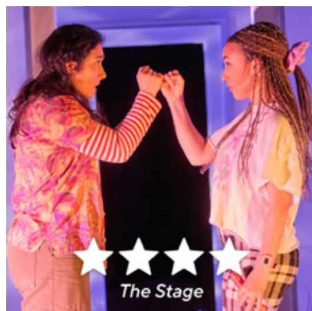
Adolygiad Imrie (2023)